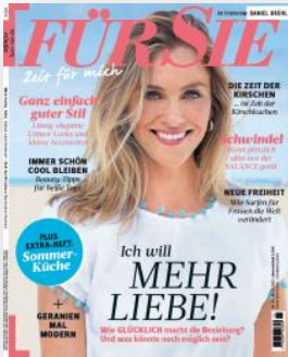
Das Bild ist als Beispiel für den Inhalt dieser Anzeigen. Bildnachricht: Annette Müller.